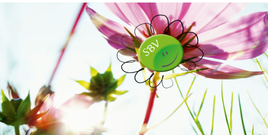
Neues von der SBV